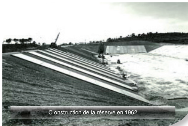
Construction de la réserve en 1962

Elle est également utilisée pour d'autres usages marginaux, comme le pompage par hélicoptère dans le cadre de la défense incendie.