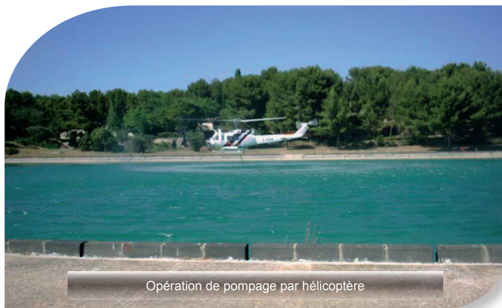
Opération de pompage par hélicoptère