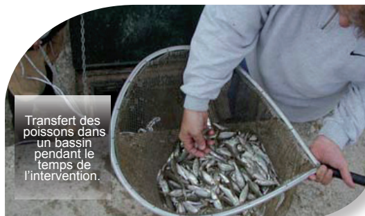
Transfert des poissons dans un bassin pendant le temps de l'intervention.

* Les boues extraites ou «les rejets chargés» sont évacués vers les bassins d'infiltration