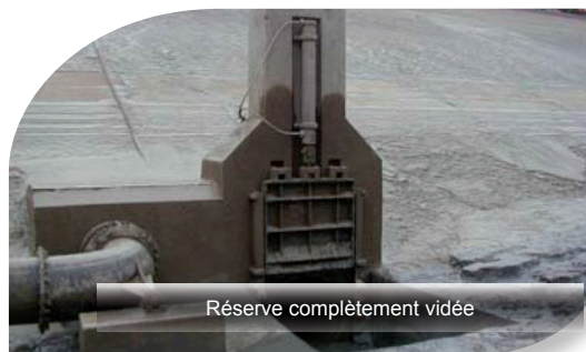
Réserve complètement vidée