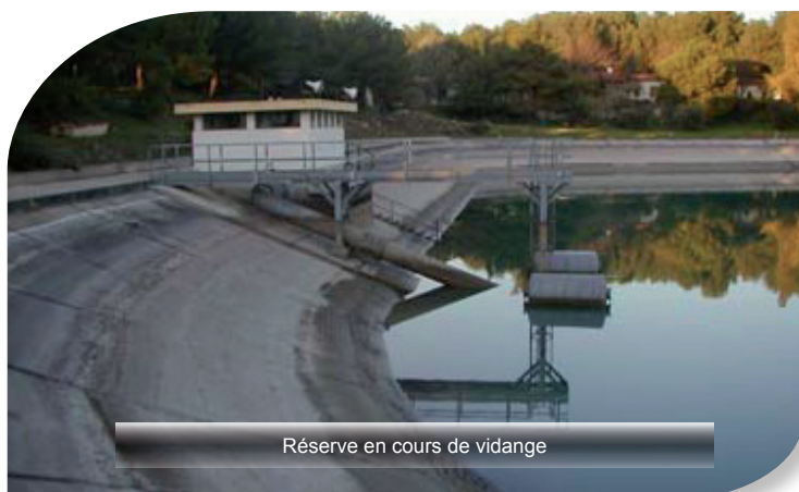
Réserve en cours de vidange